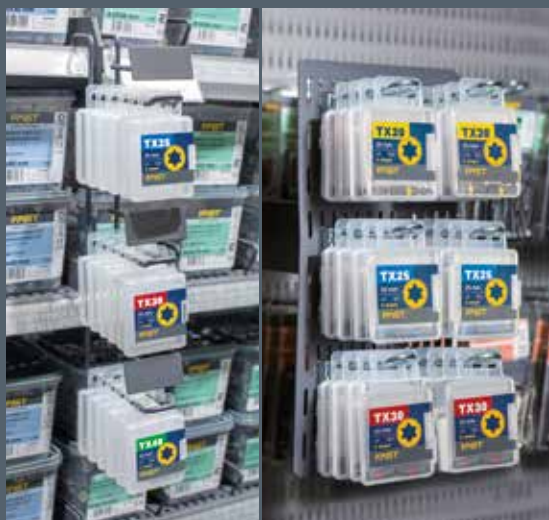
Samexponering i skruvhyllan.