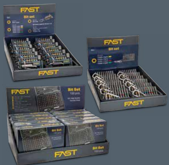
Säljande displayer ger merförsäljning.